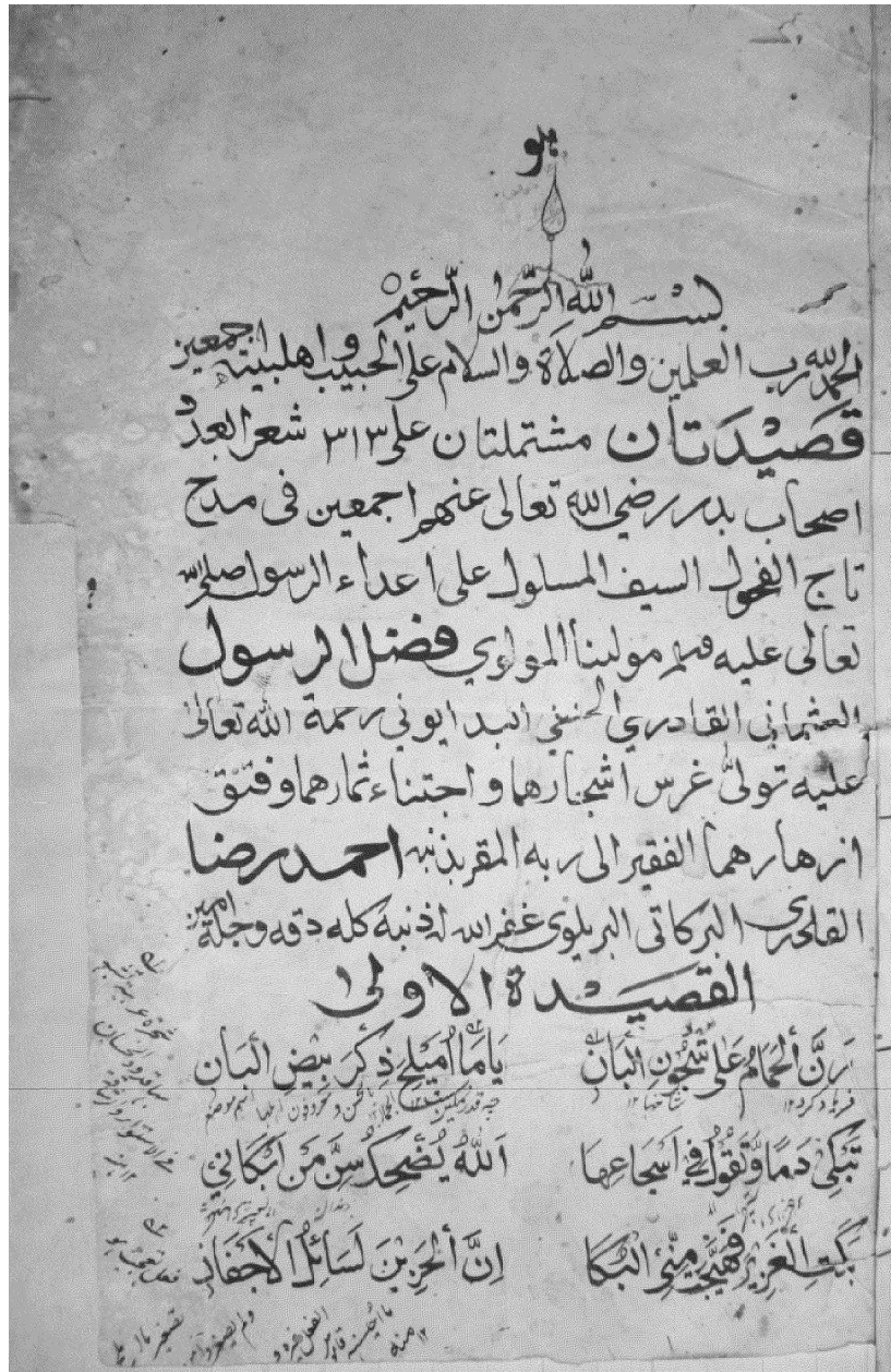
کتب خانہ قادریہ بدایوں میں محفوظ مخطوطے کا صفحہ اول